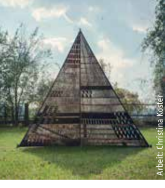
Arbeit: Christina Köster